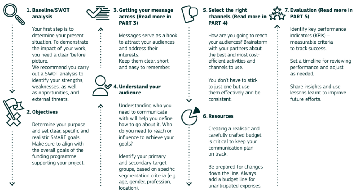
Slika 1: Sedem stopenj za pripravo načrta komuniciranja

Evropska komisija je objavila priročnik v katerem je zbrala praktične nasvete in smernice, ki upravičencem pomagajo pri načrtovanju, izvajanju in ocenjevanju komunikacijskih dejavnosti za predstavitev rezultatov projektov in njihovega vpliva na družbo. Namen priročnika je povečati prepoznavnost rezultatov projektov, doseči širše občinstvo in poudariti vpliv pobud, ki jih financira EU. V njem so odgovori, zakaj je komuniciranje pomembno, katere zahteve je treba izpolniti in kako komunicirati konkreten projekt.