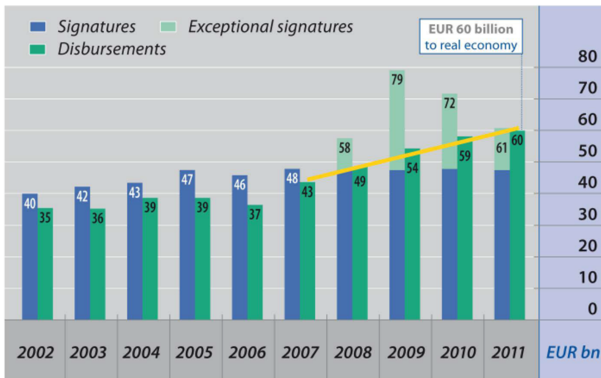
Graf 1: Zneski podpisanih pogodb in izplačil EIB od leta 2002 do 2011 v milijardah evrov

Vseh posojilnih pogodb je sklenila za 61 milijard evrov, od tega 54 milijard evrov za projekte v EU in 7 milijard evrov za projekte zunaj EU.